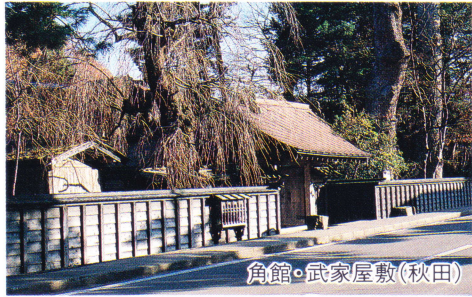
角館・武家屋敷(秋田)