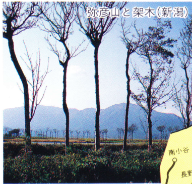
弥彦山と架木(新潟)